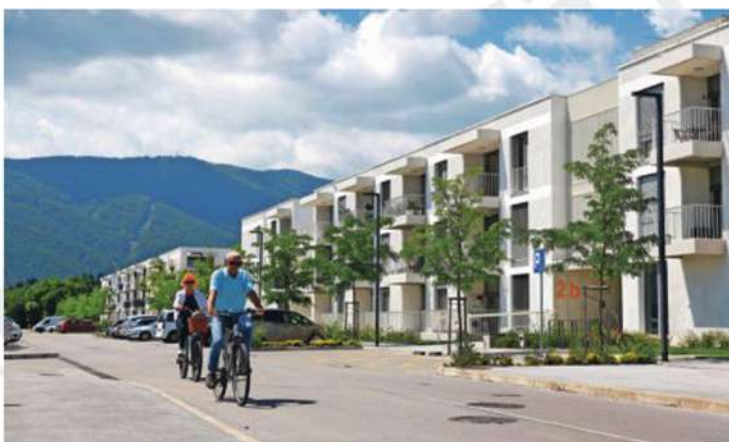
Povpraševanje po stanovanjih daleč presega ponudbo.