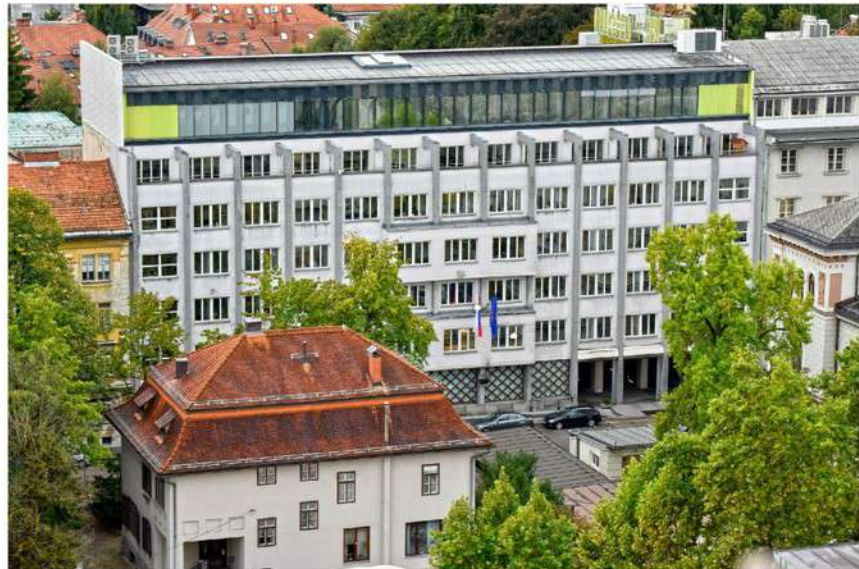
📍 Vladna palača na Gregorčičevi v Ljubljani. Težava politične levice in desnice v Sloveniji je, da "ena piše, druga briše," je opozoril Novak.

"Problem je, da so turistično obremenjene občine tudi občine, ki imajo univerze, ki imajo že tako visoke cene, kjer je veliko povpraševanje po najemnih stanovanjih, kjer so najemna stanovanja izjemno draga. To so te vroče točke! Saj ni problem občina Hajdina, problem je Ljubljana, problem je Kranjska Gora, problem so obalne občine," je sklenila.