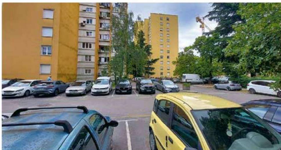
Pred bloki parkirajo dijaki, profesorji, obiskovalci zdravstvenega doma, bazena, telovadnice..., pravijo stanovalci.