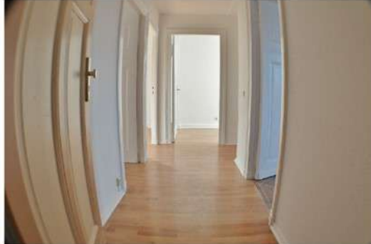
Veliko stanovanj je praznih, ker v njih lastniki "parkirajo denar" in se zadovoljijo z rastjo vrednosti. Tveganja z najemniki pa si ne želijo.