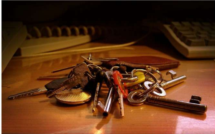
Na slovenskem najemniškem trgu vlada velik nered.