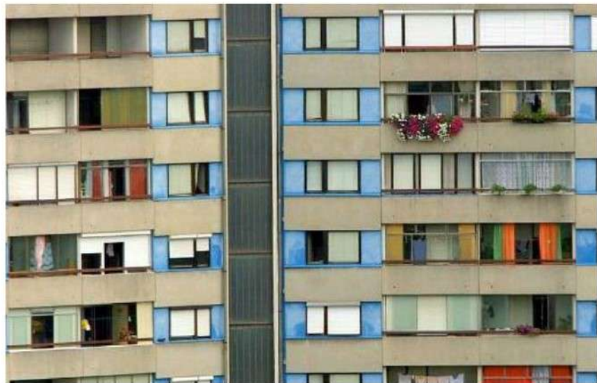
Med prijavljenimi najemnimi pogodbeni je resnična zgolj polovica, kažejo rezultati ankete med študenti v najemu.

Maša Hawlina pa je opozorila na pomanjkanje nadzora na terenu, zaradi česar je pravzaprav nemogoče vedeti, koliko je oddajanja na črno v Sloveniji. Glede na rezultate anket in raziskav, ki so bile opravljene v zadnjih petih letih, pa se ocene po njenih besedah gibljejo okoli 20 odstotkov.