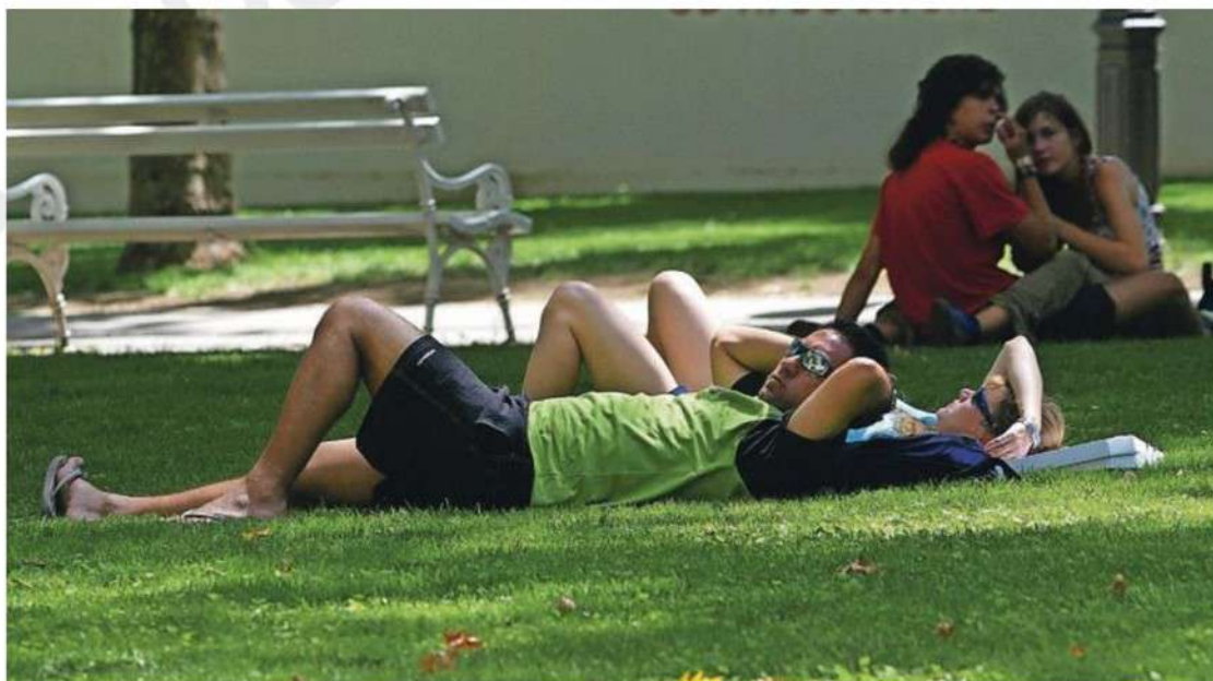
V mestnih središčih ob poletni vročini pride prav vsaka zelena površina, zato želijo pisci vizije Ljubljane do leta 2045 povezati zelene površine v enoten sistem, ki mesto ohranja prepišno in hladnejše.

Stanovanjske politike se je dotaknil tudi ljubljanski župan Zoran Jankovič. Poudaril je možnost izgradnje 45.000 stanovanj, od tega 12.000 za občinski sklad, preostala pa bi bila tržna. »Že danes sem prepričan, da edino večja ponudba stanovanj zasebnih investitorjev omogoča padec cene stanovanj ,« je dodal. Veseli ga tudi načrtovano povečanje zelenih površin v mestu. STA, N. M.