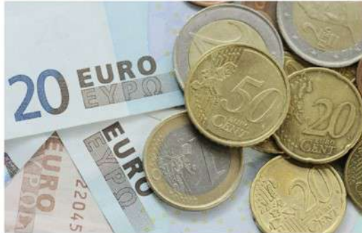
Višji kot je davek, večja je spodbuda za izogibanje oz. optimiziranje prihodka na takšen in drugačen način.

Kot primer dobre prakse Novak navaja Avstrijo in Nemčijo, kjer je verjetnost, da vas bo ujela inšpekcija, visoka, kazen pa je daleč prek praga davčne bolečine slovenskega lastnika. "V Sloveniji imamo zelo nizko kazen za ta primer in sicer od 500 do 4000 evrov. V Avstriji in Nemčiji je taista kazen od 5000 do 50.000 evrov. Kdo se boji dacarja? Prav nihče. Kdo se boji v Avstriji? Velika večina," je nadaljeval Novak in pristavil, da bomo to dosegli le, če se bo začelo vse najeme, katerih pogodbe niso prijavljene na Fursu, avtomatično obravnavati kot oddajanje na črno, kazni pa bodo na nivoju Avstrije.